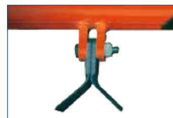
COLTELLI "Y" (universali) "Y" knives (universal) Couteaux à "Y" (universels) "Y" Messer (universal)