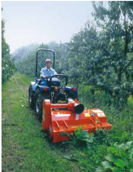
MT22 al lavoro con attacco frontale MT22 at work with front hitch MT22 au travail avec l'application frontale MT22 an die Arbeit bei der Frontanbau-Version