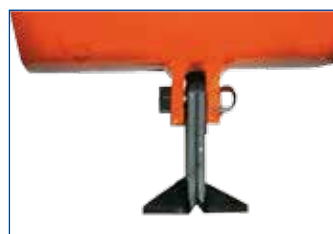
COLTELLI "T" (specifici per erba) "T" knives (special for grass) Couteaux à "T" (spécifiques pour herbe) "T" Messer (spezifisch für Gras)