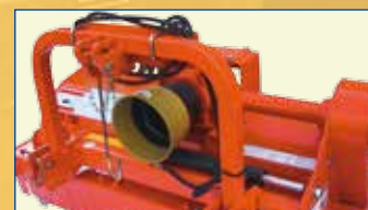
MT 23 SV

Versione con attacco scorrevole Version with side shifting Version avec attelage déplaçable Version mit Seitenverstellung