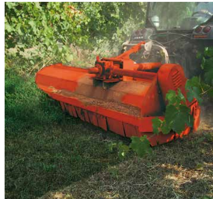
MT23 al lavoro con attacco frontale MT23 at work with front hitch MT23 au travail avec l'application frontale MT23 an die Arbeit bei der Frontanbau-Version