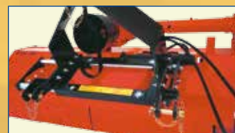
MT 22 SV

Versione con attacco scorrevole Version with side shifting Version avec attelage déplaçable Version mit Seitenverstellung