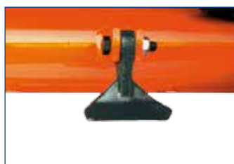
MAZZE Hammer Marteaux Hämmer